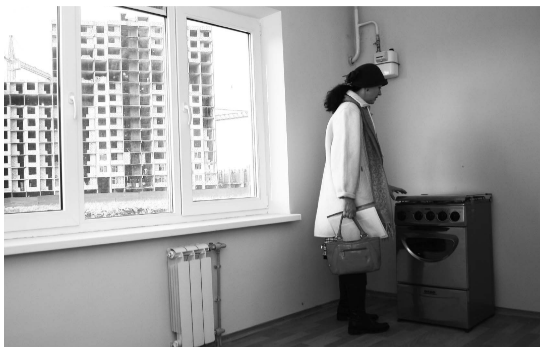
Более 50 домов возведены в Калининградской области с 2013 по 2015 год для расселения из аварийного жилья.